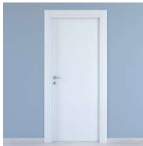
PORTE LACCATE BIANCHE