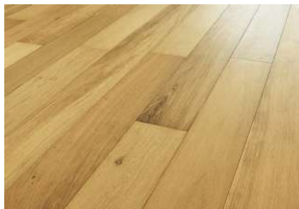
PARQUET PREFINITO IN ROVERE NATURALE, POSATO A CORRERE