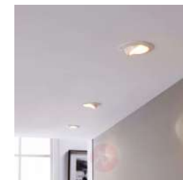
FARETTI A INCASSO