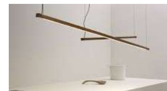
LAMPADA A SOSPENSIONE