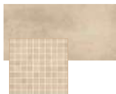
AREA CERAMICA CONTEMPORANEO 30x60 cm e 30x30 cm