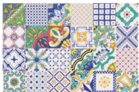
DI MAIO MACRAME' VIETRI MIX 20x20 cm