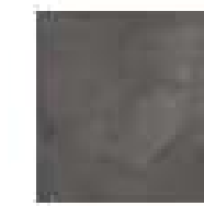
MARCA CORONA TERRA NERO 20x20 cm