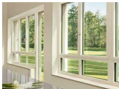
INFISSI IN PVC BIANCHI