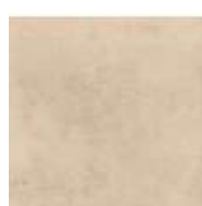
AREA CERAMICA CONTEMPORANEO 60 x 60 cm