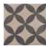
MARCA CORONA TERRA ASTRO F 20x20 cm