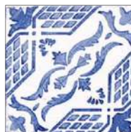
SAVOIA VIETRI BLU MIX 22x22 cm