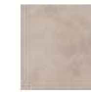
MARCA CORONA TERRA GRIGIO 20x20 cm